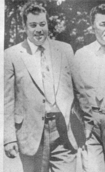
Ўн иккинчи қақриққ Ўзбекистон ССР Олий Кенгаши бешинчи сессияси иштирокчиларидан бир гуруҳи.

Бугун жумҳуриятимизда ёзиқ-овқат ва сановат молларига бўлган талаб ниҳоятда ортиб бормоқда. Бу эса биздан қардош жумҳурият ва хорижий ўлкалар ўртасидаги алоқаларни тубдан қайта