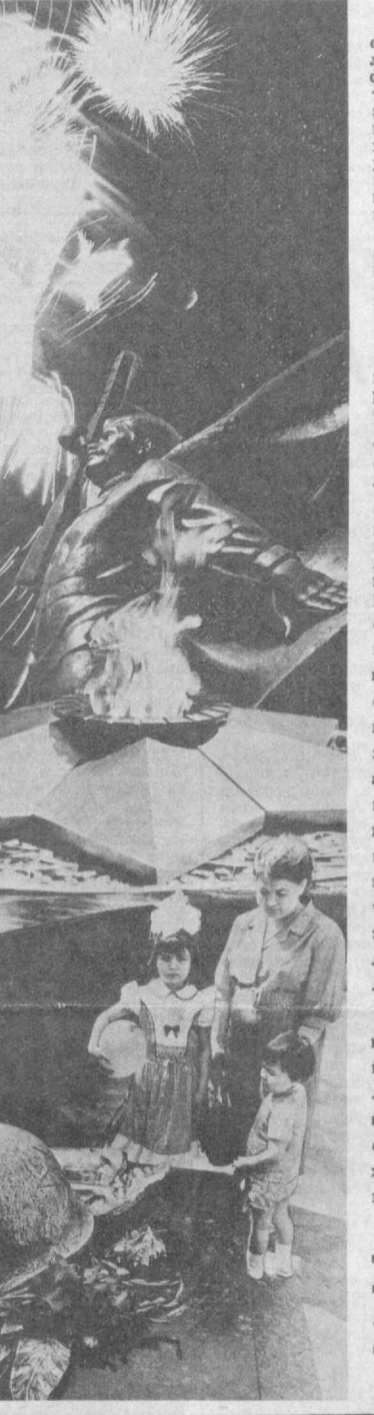
1941 йил, 22 июнь. Бу кун тарих саҳифасига энг қора, муҳим, даҳшатли кун сифатида муҳрланган. Бойси — фашистлар Германияси Совет Социалистик Республикалари Иттифоқига уруш эълон қилмай хиёнаткорона бостириб кирди. Ватан ҳаф остида қолди. Қонхўр Гитлер: СССР кўпмиллатли давлат, уруш бошлангани билан ўзаро низо чиқади ва буюк мамлакатни яшин тезлигида босиб оламан, деб хом хаёл қилган эди.