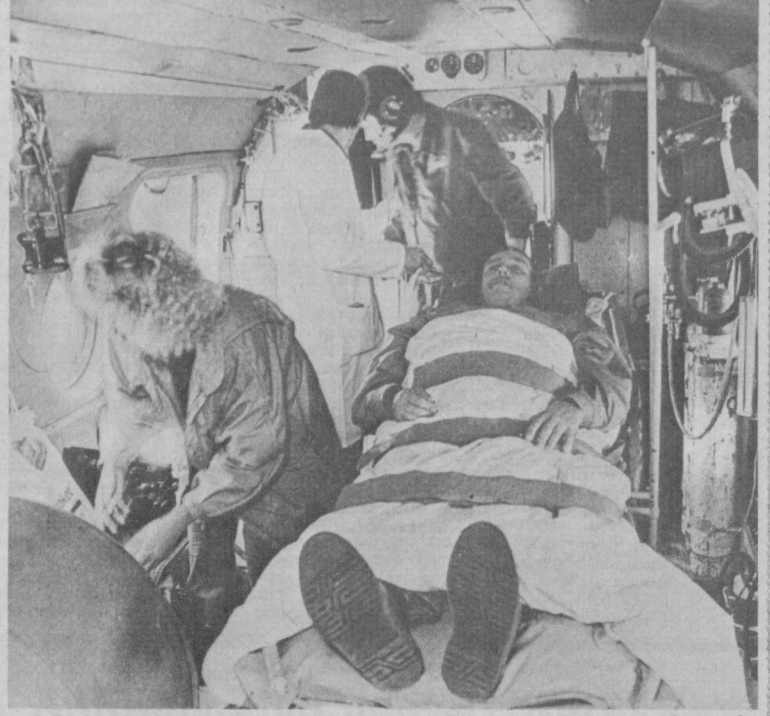
Бу йил ГФЖда транспорт ҳодисалари сони кескин кўпайди. Бунинг сабаби — ҳайдовчиларнинг интизомсизлиги ва ҳаддан ташқари тезликда юра оладиган гарб мамлакатларнинг машиналарини сотиб олган ҳайдовчиларнинг тажрибасизлигидир, деб хабар қилади АДН агентлиги. Январ ойидан бери собиқ ГДЖ ҳудудига ўлими билан тугаган бахтсиз ҳодисаларнинг сони бутун йилгидан кўпайиб кетганлиги қайд этилган.