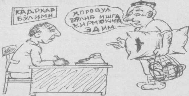
Сўзсиз сурат Абдурашул Ҳақимов чизган расм