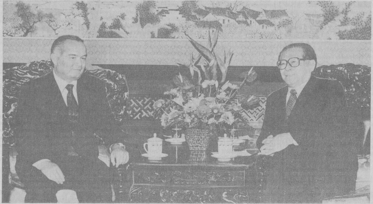
Ислам Каримов ва Хитой раҳбарлари ўзаро ҳамкорликни янада юқори поғоналарга кўтаришига умид билдирди.

Хабар қилинганидек, Ўзбекистон Республикаси Президенти Ислам Каримов 8-10 ноябрь кунлари давлат таширифи билан Хитой Халқ Республикасида бўлди.