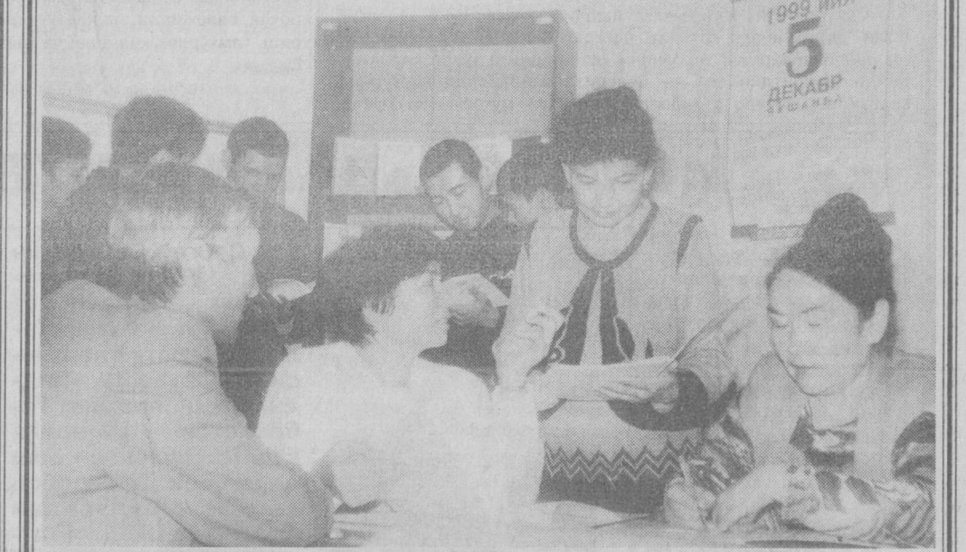
Мирзо Улғбек туманидаги картография ва геодезия техникумида жойлашган 104-сайлов участкасига сайловчилар ўзларини қизиқтирган саволларга жавоб топишлари учун барча тегшли шарт-шароитлар муҳайё этилган.

5 декабрь куни участка-мизда 2600 нафар сайловчи ўзлари танлаган, ишонган номзодга овоз беради.