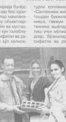
Муҳаббат ҲАБИБУЛЛАЕВА СУРАТЛАРДА: 5-Халқаро қурилиш кўргазмасидан лавҳалар.