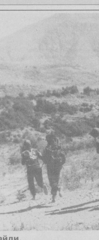
Чимён тоғлари чорлайди.

Афсуски, шундай ижобий ишлар билан бир қаторда туманда баъзи бир камчиликлар ҳам мавжуд, бундан кўз юмиб бўлмайди. Масалан, туманга қарашли коммунал хизматлардан фойдаланиш бошқармасида олиб борилаётган ишлар талабга жавоб бермайди. Ушбу бошқарма иштирокида олтига уй-жойларни таъмирлаш, фойдаланиш участкаси мавжуд. Текширувлар шуни кўрсатдики, участка бошлиқлари ободонлаштириш ишларига етарли масъулият билан ёндашмаганлар. Шу ту-