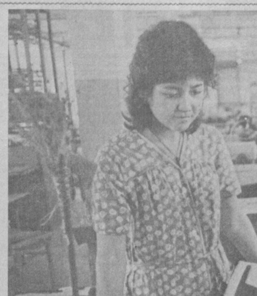
ТОШКЕНТДАГИ «ШАРҚ» — пойабзал ишлаб чиқариш бирлашмасида миллий оёқ кийимларини тикшига катта эътибор берилаяпти. Сиз суратда корхонанинг маҳсу

Устав лойиҳасида бошланғич партия ташкилотларида тортиб барча ташкилотлари «ўзларининг ички тур-