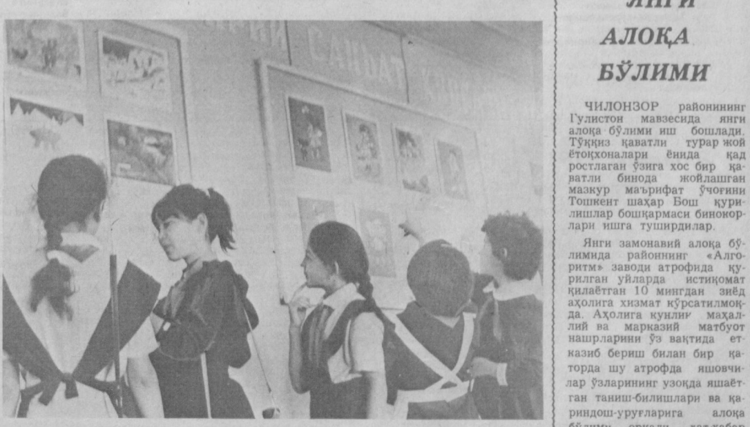
○ ШАҲРИМИЗДАГИ 276-мактабда келажак авлодини эстетик руҳда тарбиялашга катта аҳамият берилмоқда. Жумладан, бу ерда ўқувчиларнинг энг яхши ишларини иборат кўргазма докжияи фаолият кўрсатади. У ёшларнинг билим доирасини кенгайтиришда муҳим ўрни тутади. ○ СУРАТДА, ўқувчилар кўргазмага қўйилган янги тасвирий санъат намуналари билан танишмоқдалар. А. РУСТАМОВ. Мухаррир Э. М. ЭРНАЗАРОВ.

○ БУТУНИТТИФОҚ «Мелодия» фирмаси жумҳуриятимизнинг кўзга қўриган бастакорлари ижодетини қатор ибратли ишларни кенг оммалаштириш йўлида амалга оширмоқда. Фирма ҳақида ССЖИ халқ артисти, машҳур бастакор М. Ашрафийнинг энг яхши асарларини ҳам алоҳида пластинка тўплами ҳолида кўп нусхада чиқарди. Атоқли ижодкорнинг «Севги тумори» балети мазкур мусиқали ёзувда жозибали сайқал топти. Бастакорнинг биринчи симфонияси билан ҳам шу пластинка орқали танишиш мумкин. Бу ҳар иккала мусиқа асари муаллиф дирижёрлигида Ўзбекистон ССЖ Давлат симфоник оркестри икросида ёзиб олинган эди. Янги мусиқали ёзувлар бастакор таваллудининг 80 йиллигига яхши арумоғон бўлди. Улар эъозли экспонатлардан бири сифатида Тошкентдаги Мухтор Ашрафий уй-музейига қўйилди. С. ОДИЛОВА.