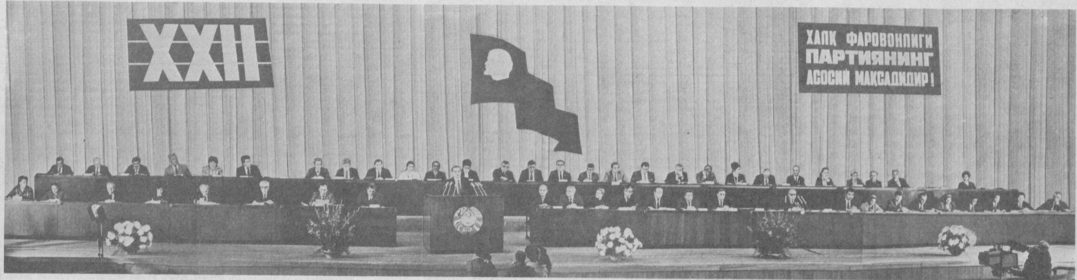
ТОШКЕНТ. 1990 йил 7 декабрь. Ўзбекистон Компартияси XXII съезди иккинчи босқичи.

Бугун Тошкентда, Санъат саройида Ўзбекистон Коммунистик партияси XXII съездининг иккинчи босқичи ўз ишини давом эттирди.