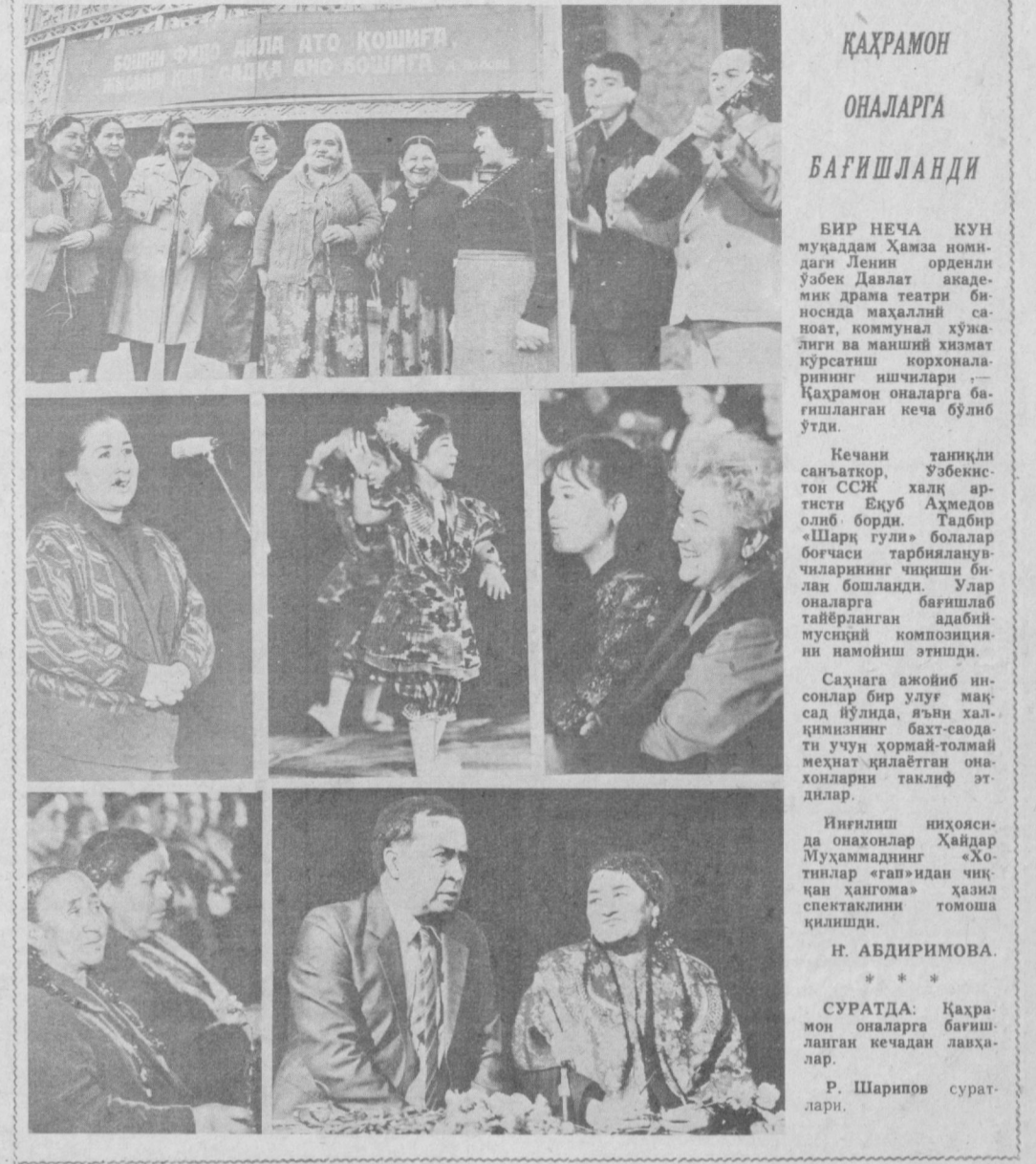
ҚАҲРАМОН ОНАЛАРГА БАҒИШЛАНДИ

СУРАТДА: дўконда.