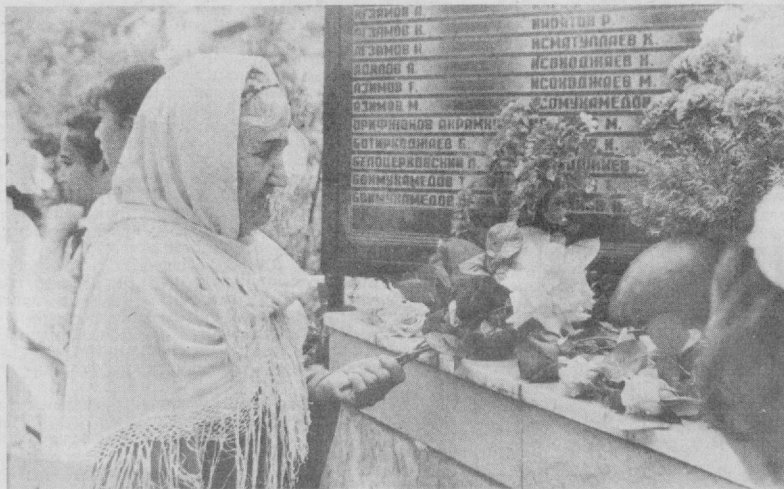
«Номингиз унутилмайди, махалладорлар...»