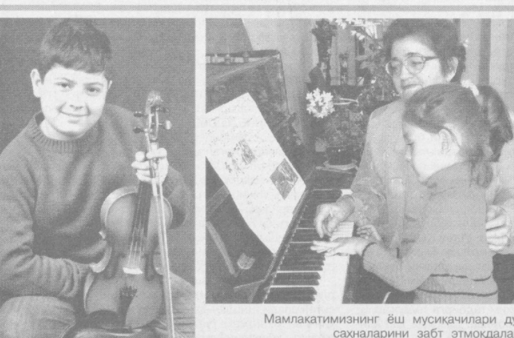
Мамлакатимизнинг ёш мусиқачилари дунё сахналарини забт этмоқдалар...