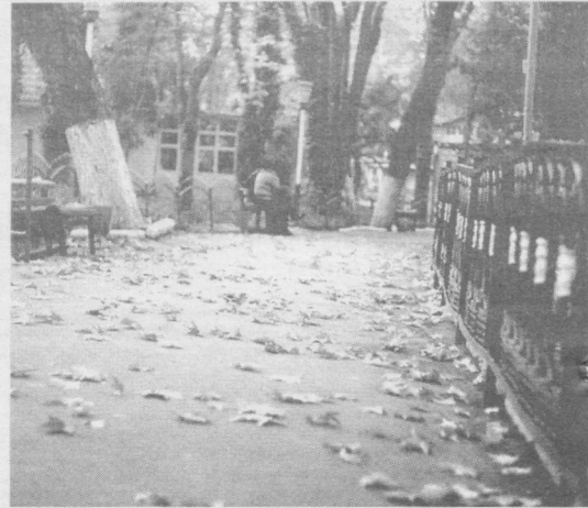
Табиат ўзининг азалий қонуниятига бўйсунди. Кузнинг ҳазоррезгига кирган барглари киш таровати тобора яқинлашиб келаётганидан дарак бермоқда.