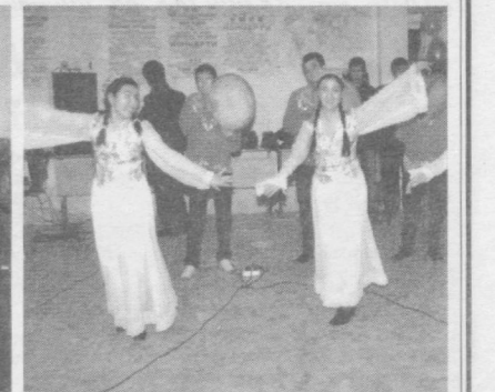
«Қўли ирок» яна Тошкентда «Чаман» ва «Умид» халқ дасталарини тузган бўлса, 1990 йили ташкилотчилик қобилиятига эга санъаткордир. Утган йиллар мобайнида у шаҳримизда «Баёт» халқ студиясини, Қувада «Анор», Жиззахда «Дўстлик чамани», Навоийда