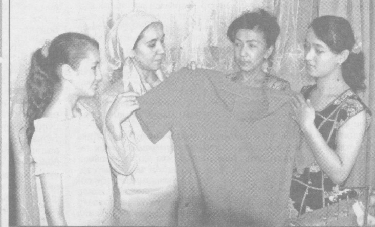
ХУСУСИЙ ТАДБИРКОРЛИК БИЛАН ШУҒУЛЛАНИБ, БОЗОР ТАЛАБИ, ХАРИДОР ДИД ВА ЭҶТИЁЖИ АСОСИДА ИШ ЮРИТАЁТГАН ИШБИЛАРМОН ХОТИН-ҚИЗЛАРИМИЗ ҲАМ ИҚТИСОДИЁТ РИВОЖИГА МУНОСИБ ҲИССА ҚЎШИШМОҚДА. ШУНИНГ БАРОБАРИДА ИШ ЎРИНЛАРИНИ ТАШКИЛ ЭТИБ, ЁШЛАРИНИНГ ҲУНАРЛИ БЎЛИШЛАРИДА ЁРДАМ БЕРИШМОҚДА.

Форумда давлатлараро йўналишларда тармоқларнинг ишончлилигини ошириш, янги электр алоқа хизматларини ишлаб чиқиш ва жорий қилиш, бир-бирига ўзаро таъсир кўрсатадиган алоқа каналларининг аxbорот хавфсизлигини яхшилаш масалалари кўриб чиқилмоқда. Шунингдек, маж-лисда телеграф тармоқларини модерни-зация қилиш, уларни маълумотлар узатиш канал ва тармоқларига ўтказиш, ай-рим мамлакатларда рақамлаштириш ре-жалари, универсал телекоммуникация хиз-матлари фондцини шакллантиришда алоқа операторларининг биргаликда иштирок этиши ҳам муҳокама этилади. Ўзбекистон алоқа ва аxbоротлаштириш агентлиги беш директорининг биринчи ўринбосари Х.Муҳитдинов мамлакатимизда Президент Ислоом Каримов ташаббуси билан қабул қилинган 2010 йилгача Ўзбеки-стон Республикаси телекоммуникация тар-момини реконструкция қилиш ва ривожлан-