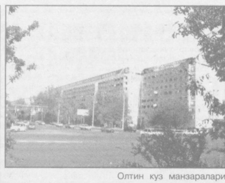
Олтин куз манзаралари