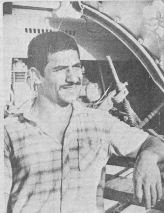
Қашқадарё вилояти, Усмон Юсуфов районидagi Улянов номи давлат хўжалигининг Субҳон Бобомуродов

Қарорда олий ўқув юрти-лари талабаларини ва махсус ўқув юртилар ўқувчиларини, шунингдек шаҳарлик шартномаси асосида жалб этилади.