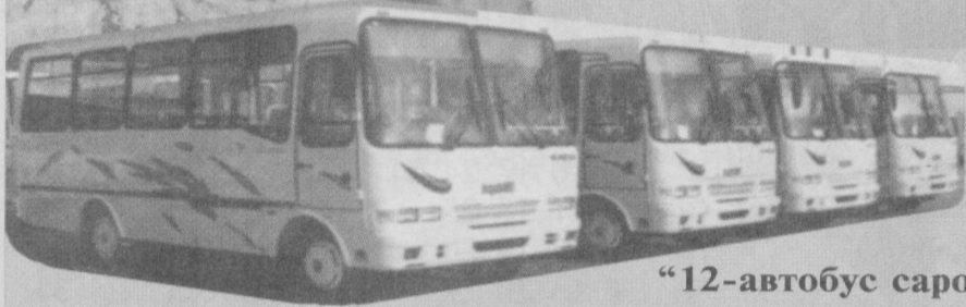
“12-автобус саройи” очик турдаги акциядорлик жамияти

Ҳамиша юртимизда тинчлик, осудалик ҳукм сурсин. Хонадонларимиздан бахт-саодат, тўкин-сочинлик аримасин. Қутлуғ йилда диниғиздаги барча эзгу ниятлар амалга ошсин.