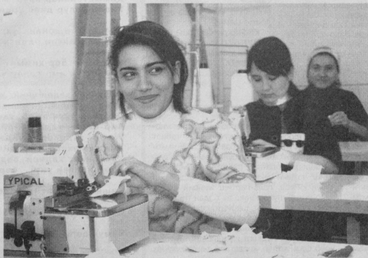
Пойтахтимида фаолият кўрсатаётган «Шафқат-текстиль» кўшма корхонаси тадбиркорлари нафақат ички, балки хориж бозориди ҳам ўз харидорларига эга бўлишга интилишмоқда. Бунинг учун эса рақобатбардош маҳсулот турларини кўпайтириш, замонавий техника ва технологиялардан самарали фойдаланиш, маркетинг ишларини яхши йўлга қўйишга катта эътибор қаратишмоқда.

Тошкент шаҳар ҳокими Я.Матбобут хизмати ва ўз муҳбирларимиз хабарларидан.