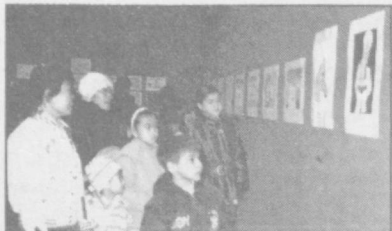
ШАҲРИМИЗДАГИ ФОТОСУРАТЛАР УЙИДА «МЕН ДУНЁНИ ЧИЗАМАН» НОМЛИ БОЛАЛАР СУРАТЛАРИНИНГ КЎРГАЗМАСИ ОЧИЛДИ.