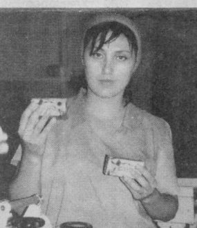
масса идишларда кадоқланмоқда. Шунингдек, ўтган йилда 10 турдаги маргарин ва 6 хил май-

Бу борада, албатта, бозор талаби, харидор эҳтиёжи эътибор олинмоқда. Бугунги кунга келиб корхонада биргина пахта ёғининг 3 хили ярим литрдан тортиб 4 литргача бўлган пласт-