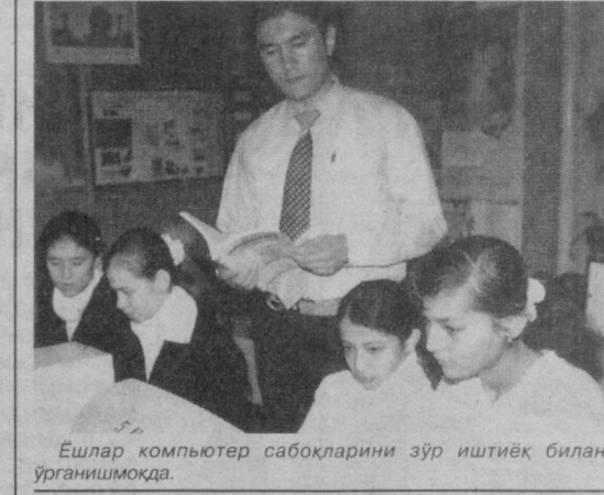
Ёшлар компьютер сабоқларини зўр иштиёқ билан ўрганишмоқда.

Махмуд БОБОНАЗАРОВ, «Жаҳон» АА мухбири Берлин