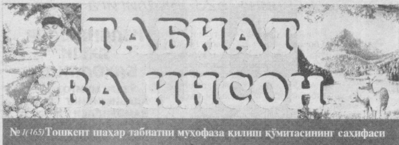
№ 1163 Тошкент шаҳар табиати муҳофазаси қилиш қўмитасининг саҳифаси