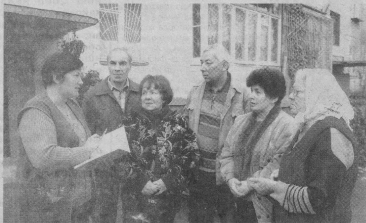
ЎЗАРО ИШОНЧ, ҲАМҲИЖАТЛИК ҲУҚМ СУРГАН ЖАМОАДА БИР-БИРИНИ ТУШУНИШ ҲАМ ОСОН БЎЛАДИ. БУ ЭСА ҲАР ҚАНДАЙ МАСЪУЛИЯТЛИ ИШНИ БАЖАРИШДА, МУАММОЛАР ЕЧИМИНИ ТОПИШДА ҚЎЛ КЕЛИШИ, ШУБҲАСИЗ.

Ўйимиз 6 та кириш йўлигидан иборат бўлиб, ҳар бири учун маъсул йўлакбошларини яшовчиларнинг ўзлари танлашган. Шу боис ҳам йўлакларда яшовчи хонадон эгалари навбати билан тозаловчи эътибор қаратишди. Ҳозирча ҳеч қим норози бўлгани йўқ. Ақсинча, фарзандларимиз ҳам ўз уйлари, ўлакларини учун қайғуришга ўрганилмоқда. Шу ўринда таъкидлаш айтаётганимни, аёллар яшаган жой ҳаммаша ораста бўлиши керак. Шунинг учун ҳам остига вақтимизни йўлакларимиз учун ажратсак, бу фақат ўзимизга, дилмиз равшанигига фойда. Агар ободлик кўнгилдан бошланади.