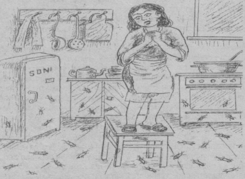
Изоҳға ҳожат йўқ.

Раҳимжон дадасидан сўради: — Дада, ер нима учун айланади? — Унга жавобан дадаси бақирди: — Яна менин коньягимни ичиб қўйдимми, зумраша?