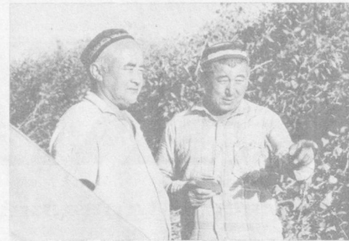
Урта Чирчиқ районидagi «Северний маяк» колхозига лубкорлар эрта баҳордан бери фидокорона меҳнат қилиб...