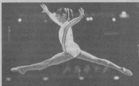
СУРАТДА: Монреаль Олимпиадасининг учта олтин медалига сазовор бўлган руминиялик гимнастикачи Нада Комэнэч.

Инсоният тафаккури учқунни бир неча лаҳза ичида коинот орқали минглаб километр масофага етказиб беришга қодир бўлганлигига қойил қолган ҳолда унинг ўз курраи заминидаги муаммоларни ҳал этишда баъзан оғирлик қилишдан ажабланмасликнинг иложи йўқ. Монреаль Олимпиадаси атрофида ҳам кескин сиёсий танглик юзага келди. Бунга Канада ҳукуматининг 1975 йилда Тайвань ороли спортчиларига Олимпиадада иштирок этишларига рухсат бермаслиги тўғрисидаги баёноти сабаб бўлди. Тайванликлар ўйинларда "Хитой Республикаси" вакиллари сифатида иштирок этишларини билдирган эдилар.