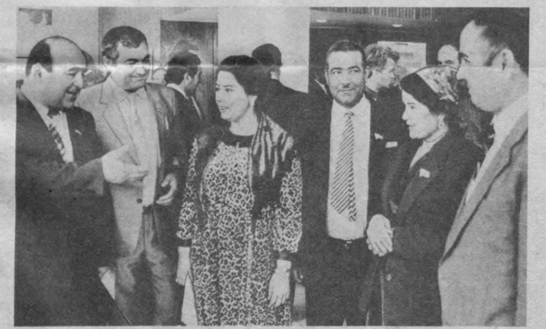
СУРАТДА: қашқадарёлик депутатлардан бир гуруҳи.