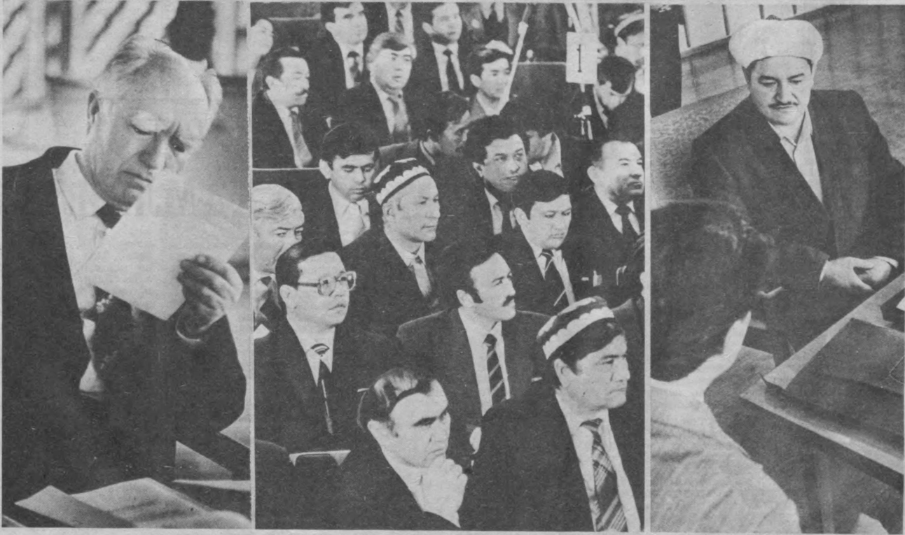
Ўзбекистон ССР Олий Совети сессиясининг мажлислар залида.