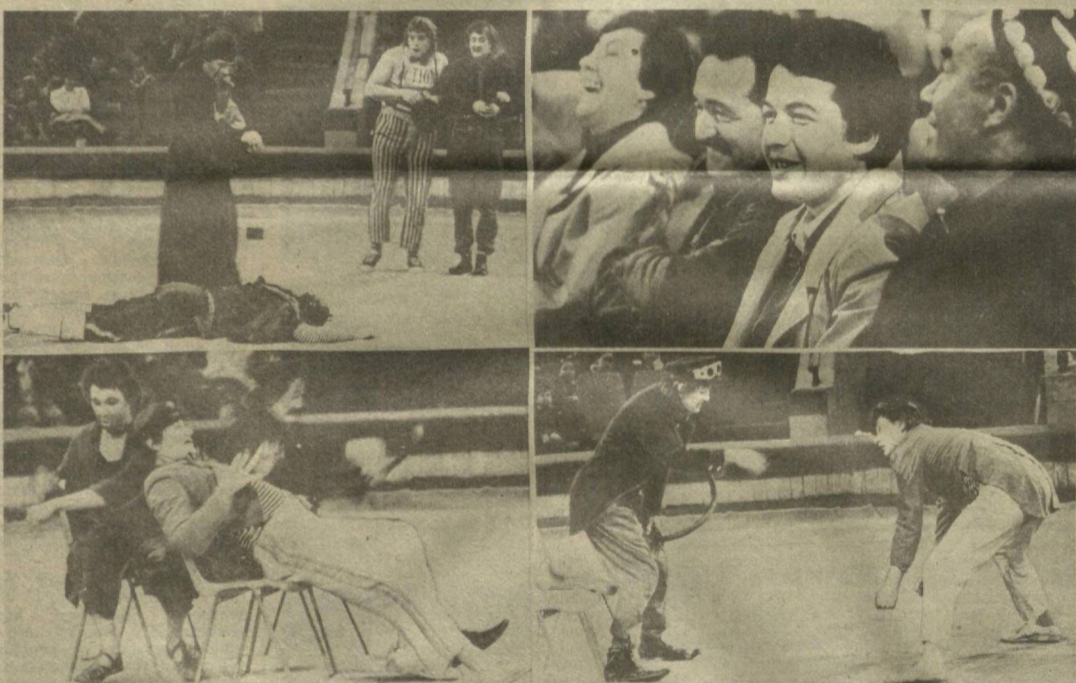
Тошкент давлат цирки айниқса дам олиш кунлари гажум бўлади. Бу ерга таширф буюрган кенсая бш томошалардан завиқ олиб, ириқиб хордиқ чиқаради. А. ЗУФАРОВ олган ушбу суратларда цирки лаҳзалари аниқ этган.