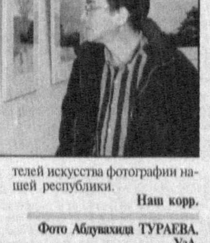
Наш корр.