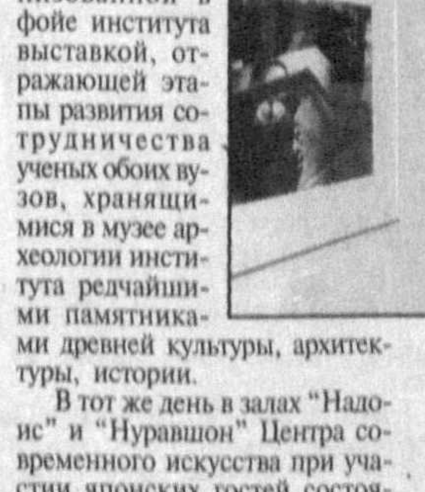
Наш корр.