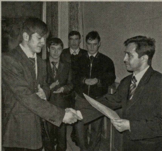
Олий Мажлис Қонунчилик палатасида