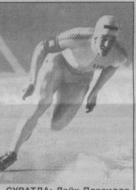
СУРАТДА: Лейк-Плэсидда конькида югуриш бўйича эркинлик ўртасида барча олтин медалларни қўлга киритган АҚШлик Эрик Хейден.