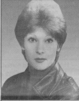
СУРАТДА: тошкентлик волейболчи, йигирма иккинчи Олимпиада ўйинларининг чемпиони Лариса Павлова.