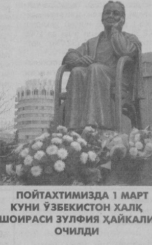
ПОЙТАХТИМИЗДА 1 МАРТ КУНИ ЎЗБЕКИСТОН ХАЛҚ ШОИРАСИ ЗУЛФИЯ ҲАЙКАЛИ ОЧИЛДИ