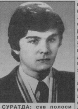
СУРАТДА: сув полоси бўйича Олимпиада чемпиони Эркин Шагаев.