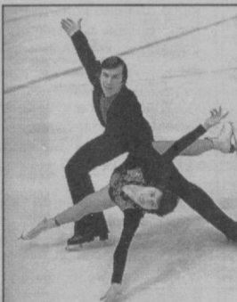
СУРАТДА: фигурали учиш бўйича "олтин жуфтлик" — Ирина Роднина ва Александр Зайцев.