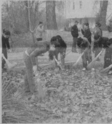
Дилором ИКРОВА СУРАТЛАРДА: экологик ҳашардан лавҳалар.