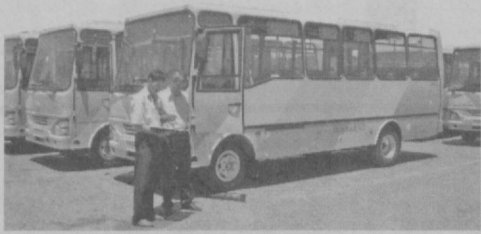
актриса кўзда тутилган. Яқин кунларда ана 10 та «Исузу» микроавтобуси келиши кутилмоқда.

— Албатта, биз бу эришганимиз ютуқларимиз билан чеklangиб қолаётганимиз йўқ, — деб сўзида давом этди Қ.Зиқиров. — Аҳолига транспорт хизмати кўрсатиш даражасини янада яхшилаш мақсадида «Тошшаҳартрансхизмат» уюшмаси раҳбарияти билан ўзаро келишув ишлари олиб бормоқда. Унга кўра жорий йилда Германиядан келтириладиган 200 та «Мерседес-Бенц» автобусидан 20 тасини автосаройхонамизга