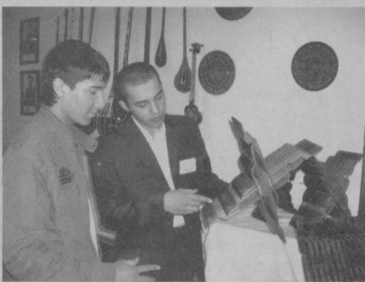
Юртимизда кейинги йилларда тadbиркорлик ва хўнармандчилик ривожига барча шарт-шароитлар яратилмоқда. Биргина Президент соврини учун аънавий равишда ўтказиладиган «Ташаббус» кўрик-танловининг Шайхонтоҳур туман босқичида 20 нафарга яқин ёш ўймақори, миллий асбоблар устаси, зардўз, заргар, миллий либосчи, миниатюрчи, ранг-тасвирчи расом, қўлолосозлар қатнашгани қўнғорли, албатта.

СУРАТДА: Шайхонтоҳур туманида фаолият юритаётган ёш, изланувчан хўнармандлар.