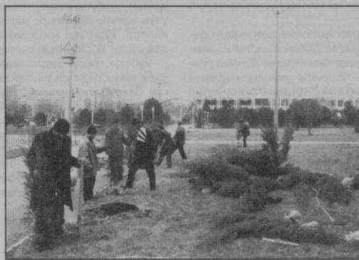
«Ёшлар йили» Давлат дастурида кўзда тутилган тадбирларни амалга ошириш. Меҳрибонлик ва Муруват уйлари ва бошқа иختисослаштирилган муассасаларнинг моддий-техника базасини яхшилашга сарфланади.

Умумхалқ хайрия ҳашаридан тушган маблағлар аҳолининг ёрдамга муҳтож қатламга, шу жумладан, кўп болали ва кам таъминланган ёш оилаларга, ногирон ва ёлғиз кексаларга моддий ва маънавий ёрдам кўрсатиш, иқтидорли ҳамда ногирон ёшларни қўллаб-қувватлаш, шунингдек