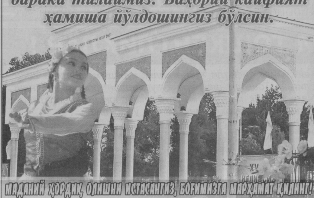
МАДАНИЙ ҲОРДИҚ, ОЛИШНИ ИСТАСАНГИЗ, БОҒИМИЗГА МАРҲАМАТ ҚИЛИНГ!

билан самимий қутлайди. Сизларга мустаҳкам соғлиқ, бахт- омад, хонадонларингизга файзу барака тилаймиз. Баҳорий кайфият ҳамиша йўлдошингиз бўлсин.