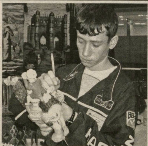
нинг муҳим вазифалари орасида ёшларнинг касбий ўсишлари, замонавий ишбилармонлик муҳитида мослашувчанлиги, касб танлаш ва ишга жойлашишларида ёрдам кўрсатиш устувор туради.

Мазкур кўргазма Ўзбекистон Республикаси Савдо-саноат палатаси ҳамда Олий ва ўрта махсус таълим вазирлиги, Тошкент шаҳар ўрта махсус, касб-ҳунар таълими бошқармаси кўмағида ташкил қилинди. Маълумки, фарзандларимизнинг ҳар томонлама чуқур ва пухта билим эгаллаши, жамиятда муносиб ўрнини топишига кўмаклашиш давлатимиз сийосатининг устувор йўналишларидандир. Мамлакатимизда таълим соҳасида олиб борилаётган ислохотлар, Президентимиз ташаббуси билан қабул қилинган «Таълим тўғрисида»ги қонун, Кадрлар тайёрлаш Миллий дастури ҳамда 2004-2009 йилларда Мақтаб таълимини ривожлантириш Давлат умуммиллий дастури бу борада муҳим ҳуқуқий асос бўлиб хизмат қилмоқда. Бугунги кунда мамлакатимиз жуда катта интеллектуал ва илмий салоҳиятга эга. Ҳуқуқимизда ёш авлод таълим-тарбияси, шунингдек, ёшларнинг чуқур ва муқаммал билим олиши ва касб-ҳунар эгаллашларига алоҳида эътибор бермоқда. Шунинг таъкидлаш кераки, Савдо-саноат палатаси фаолияти-