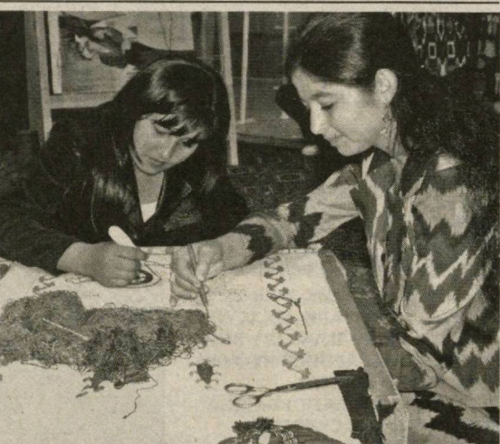
этишдан иборатдир. Ушбу кўргазма таълим йўналишлари, ўқув ускуна ва анжомлари, жиҳозлар ишлаб чиқарувчилари билан истеъмолчилар ўртасида бевосита алоқа ўрнатишга ҳам хизмат қилади. Айтиш жоизки, «Таълим ва мутахассислик» иккинчи халқаро кўргазма таълим соҳасидаги илгор ютуқларини намойиш этиш баробарида қатнашчилар ўзларини қизиқтирган кўпгина саволларга жавоб топишида ҳам ёрдам беради албатта.

«Таълим ва мутахассислик» иккинчи халқаро кўргазманинг мақсади ҳам қатнашчиларни илгор таълим хизматларининг нафақат Ўзбекистонда, балки чет элларда ҳам мавжуд тўлиқ қўламли билан таништириш, бўлажак абитуриентларга олий ва ўрта махсус ўқув муассасасининг энг мақбул танловига кўмак бериш ҳамда таълим соҳасидаги хизмат турлари, ўқув-методологик адабиётлар, компьютер тизимлари ва дастурларини ўрганиш соҳасидаги энг сўнги ютуқларини намойиш