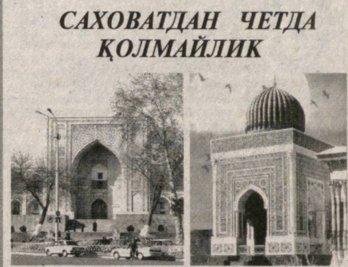
Мамлакатимиз пойтахти—Тошкент шаҳрида жойлашган, халқимиз маънавий меросининг узвий бир қисми бўлган Ҳазрати Имом (Ҳастимом) меъморий мажмуасида қурилиш, таъмирлаш ва ободонлаштириш ишларини амалга ошириш мақсадида «Ҳазрати Имом (Ҳастимом) жамоатчилиги жамғармасини қўллаб-қувватлаш тўғрисида» Президентимиз томонидан қабул қилинган Қарор бундан ҳамюртларимизнинг кўнгилларини хушнуд этди. Зеро, ушбу Қарор муқаддас ислом дини ва фалсафасини, унинг инсонпарварлик гоёларини кенг ёйишга хизмат қилиб келатган йирик илмий-маърифий марказнинг асл тарихий қиёфасини тиклаш, бу ерда кенг кўламли қурилиш-таъмирлаш ва ободонлаштириш ишларини амалга ошириш, мажмуанинг инфра-тузилмасини ҳар томонлама ривожлантиришда муҳим ўрин тутмади.

Улайимизки, мамлакатимизда бу улуг ва савобли ишга ўз ҳиссасини қўйиш ниътида бўлган инсонлар, қорхона, ташкилот ва муассасалар, тадбиркор ва ишбилармонлар қўллаб-қувватланади.