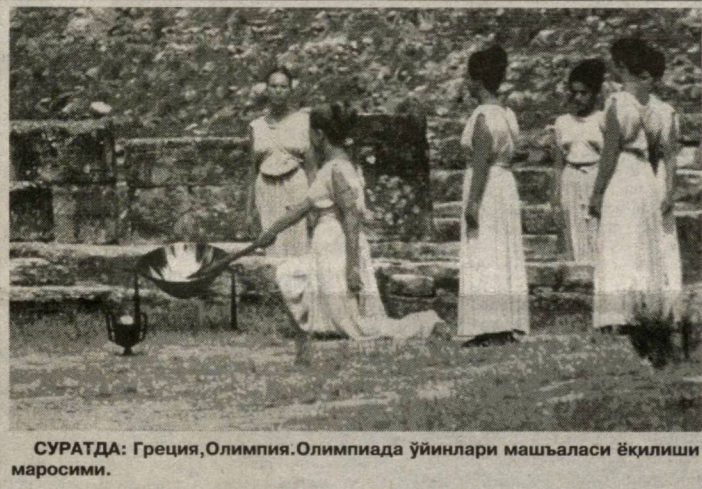
СУРАТДА: Греция, Олимпия. Олимпиада ўйинлари машъаласи ёқилиши маросими.

Юнон ривоятларини ёдга олайлик. Умумэлли байрамларининг энг олийси — Олимпиада ўйинлари юнонлар илоҳлар илоҳи деб ҳисоблаган Зевс шарафига уюштирилганлигида қатта ҳикмат бор. Олий илоҳ, унга сажда қилувчилар ўзлари улуглашаридек, фақатгина "мусаффо само", "яшин чақнатувчи", "булутларни ҳайдовчи", яъни бекиёс қудрат тимсолигидан эмас. Зевс, шунингдек, "ҳаёт бахш этувчи", юнон шоири Эсхил таъ-