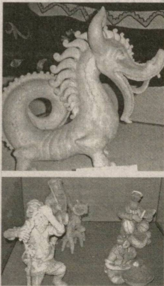
Музей коллекциялари ичда ўзига хос бўлган, кулолчиликнинг бир турига тегишли ҳайкалчаларнинг 400 дан ортиқ хиллари йиғилган.