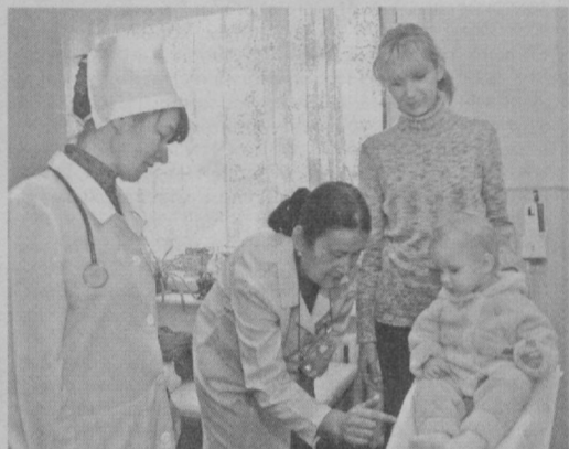
Шахримиздаги 23-оилавий поликлиниканинг шифокору ҳамширалари она-бола саломатлиги йўлида сидқидилдан меҳнат қилмоқдалар.