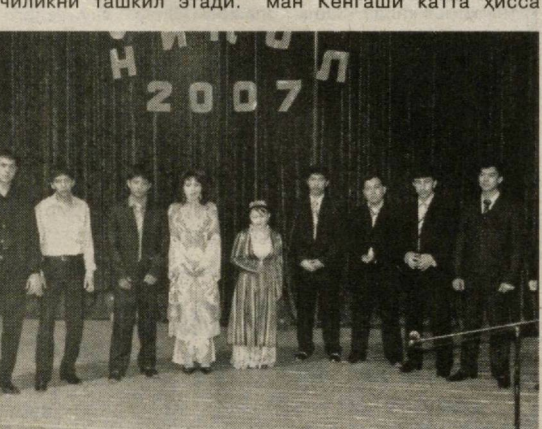
Дарҳақиқат танловда санъат шайдолари бўлган ёшлар ўзларининг дилрабо куй-қўшиқлари, жозиба-ли рақсларини катта маҳорат билан ижро этиб, ҳайъат аъзолари томонидан муносиб баҳо олдилар. Хусусан, чолғучилик йўналиши кўшдилар. Танлов қатнашчилари ташкилотчилар ва ҳомийлар томонидан диплом ва эсдалик совғалари билан тақдирландилар.

Айни кунларда шаҳримизда «Ниҳол» кўрик-танловининг туман босқичлари давом этмоқда. Кўни кеча Сергели туманидаги 21-музыка мактабига мазкур танловнинг туман босқичи бўлиб ўтди.