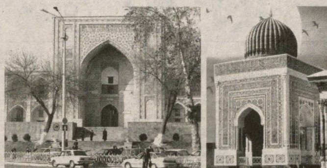
ҲАЗРАТИ ИМОМ (ҲАСТИМОМ) ЖАМОАТЧИЛИК ЖАМҒАРМАСИНИНГ ҲИСОБИ РАҚАМЛАРИНИ МАЪЛУМ ҚИЛАМИЗ: СТИР: 206849483 МФО: 00423 Х/р: 20212000604589442001 АТИБ Ипотека банки Меҳнат филиали

Мамлакатимиз пойтахти—Тошкент шаҳрида жойлашган, халқимиз маънавий меросининг узвий бир қисми бўлган Ҳазрати Имом (Ҳасимом) меъморий мажмуасида қурилиш, таъмирлаш ва ободонлаштириш ишларини амалга ошириш мақсадида «Ҳазрати Имом (Ҳасимом) жамоатчилик жамғармасини қўллаб-қувватлаш тўғрисида» Президентимиз томонидан қабул қилинган Қарор бутун ҳамюртларимизнинг кўнгилларини хушнуд этди. Зеро, ушбу Қарор муқаддас ислом дини ва фалсафасини, унинг инсонпарварлик ғояларини кенг ёйишга хизмат қилиб келаётган йирик илмий-маърифий марказининг аса тарихий қиёфасини тиклаш, бу ерда кенг қўламли қурилиш-таъмирлаш ва ободонлаштириш ишларини амалга ошириш, мажмуани инфра-тузилмасини ҳар томонлама ривожлантиришда муҳим ўрин тутади.