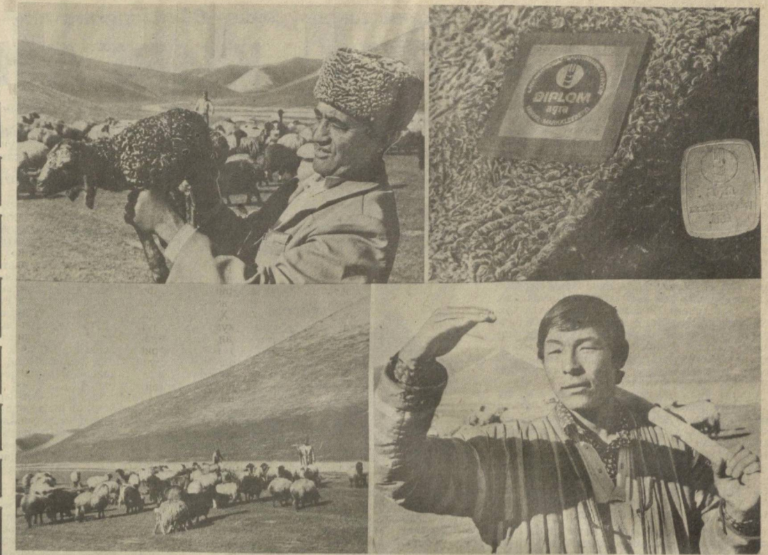
Шу кунларда Сурхон яловлари ўзгача манзара касб этган. Чўпон-чўлиқларнинг қўли-қўлга тегмайди. Қумқўрғон районидagi Гагарин номи давлат наслчилик хўжалигида 53.165 бош совлиқ парварши қилинмоқда. Жорий йилда уларнинг ҳар юз бошидан 102 тадан соғлом қўзи олин кўзда тутиляпти. Қўйчовонлар тўл маъмуини муваффақиятли ўтказиш, отарга отар қўиш йўлида тиним билмаётганлар. Хўжаликда етиштирилган сержило қоракўл терилар халқро қўргазмаларда намойиш этилиб, муносиб тақдирланган.

«Ўзбекстильмаш» Енгил саноат министрлиги билан келишган ҳолда ташкил этилаётган район ва шаҳар саноат комбинатлари ишлаб чиқаришлари, меҳнатни ташкил этишнинг касаначилик шакллари кенгайтириш учун механизациялашган нархлар ва бошқа тўқимачилик ускуналари тайёрлаш йўлга қўйиш тўғрисидаги масалани кўриб чиқишга қарор қилинди. Хукумат қарори билан Қорақалпоғистон АССР Министрлар Советига, область ижроия қўмиталарига: