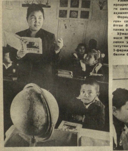
Узбекистон Компартияси Марказий Комитетининг халқ таълими жонкуярларига мурожаатнома мактаб ислохотини маддалаштириш йўлида янги омил бўлди. Унда қишлоқ мактаблари иштини жонлантиришга алаҳида аҳамият берилган.

Шунинг учунми, 1989 йили Буюк ипақ йўли бўйлаб уюштирилган халқаро экспедицияда бир неча бор бонг урдилар. Лекин ҳамон аҳоли «эски ҳамом — эски тос» қабилида. Лоқадилгимиз оқибатида бундай ёвузликлар ҳозирги кунда ҳам давом этмоқда. Юқорида тилга олинган Поп тоғи тоғидаги ўзлаш маданиятимиз тарихида муҳим янгилик бўлди.