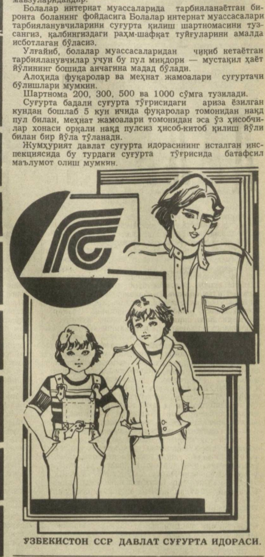
ЎЗБЕКИСТОН ССР ДАВЛАТ СУҒУРТА ИДОРАСИ.

ТАШКИЛОТЛАР ВА КОРХОНАЛАР, ЖАМОАТ ТАШКИЛОТЛАРИНИНГ РАҲБАРИ ВА АҲОЛИ ДИҚҚАТГА! ДАВЛАТ СУҒУРТАСИДАГИ ЯНГИЛИК Бу — БОЛАЛАР ИНТЕРНАТ МУАССАЛАРИНИНГ ТАВРИЯЛАНУВЧИЛАРИНИ СУҒУРТА ҚИЛИШ ШАРТНОМАСИНИ ТУЗИШДИР. Шафқатлилик, раҳмдиллик — шу куннинг долзарб мавзударидадир. Болалар интернат муассасарида тарбияланаётган бирон-та боланинг фойдасига Болалар интернат муассасари тарбияланувчиларини суғурта қилиш шартномасини туз-сангиз, қалбнингиздаги раҳм-шафқат туйғуларини амалда исботлаган бўласиз. Улгайиб, болалар муассасаридан чиқиб кетаётган тарбияланувчилар учун бу пул миқдори — мустақил ҳаёт йўлининг бошида анчагина мадад бўлади. Алоҳида фуқаролар ва меҳнат жамоалари суғуртачи бўлишлари мумкин. Шартнома 200, 300, 500 ва 1000 сўмга тузилади. Суғурта бадали суғурта тўғрисидаги ариза ёзилган кундан бошлаб 5 кун ичида фуқаролар томонидан нақд пул билан, меҳнат жамоалари томонидан эса ўз ҳисобини билан бир йўла тўланади. Жумҳурият давлат суғурта идорасининг исталган инспекциясида бу турдаги суғурта тўғрисида батафсил маълумот олиш мумкин.