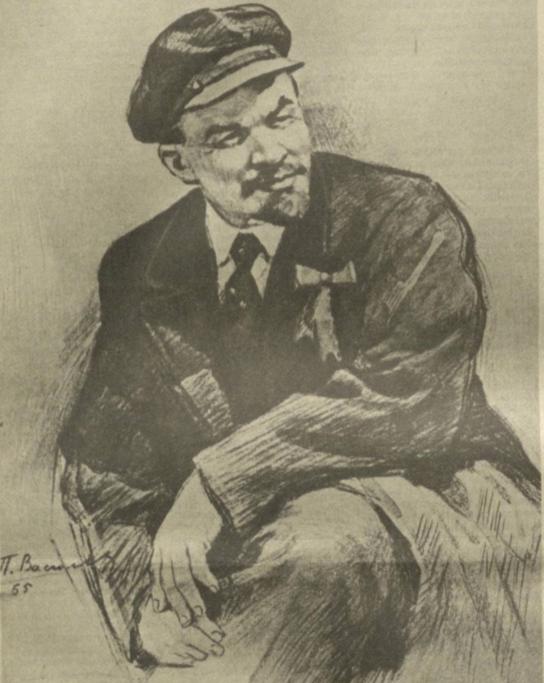
«В. И. Ленин».

тарихни бойитиш учун майдонга чиққан, аммо шу кучларнинг ўзи бузғунчилик стихиясига айланб кетиши мумкин бўлган жуда мушкул вазиятда қатъий ва узи-кесил тадбирга шай бўлиб турган инқилобчи намунаси сифатида биз билан биргадир. Лениннинг тарихга таъсир кўрсатишининг сирини унинг ҳаракатга келтирувчи кучларига аниқ баҳо бера олиш ва сиёсатда ҳозирги лаҳза муқаррар, келажак бор омиллари қўлиб олиб бориш қобилиятидадир. Лениннинг сиёсатчи ва назарийчи сифатида тез ўзгариб бораётган вазият шароитларидаги ўттиш давлари учун диалектик салоҳияти алоҳида қимматга моликдир. Зид омиллари яамул-жамини қамраб олиш ва бош (Давоми иккинчи бетда).