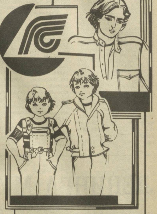
ЎЗБЕКИСТОН ССР ДАВЛАТ СУҒУРТА ИДОРАСИ. «Союзреклама» Бутуниттifoқ ишлаб чиқариш бirlашмасининг Ўзбекистон реклама ишлаб чиқариш корхонаси.

БҲ — БОЛАЛАР ИНТЕРНАТ МУАССАСАЛАРИНИНГ ТАРБИЯЛАНУВЧИЛАРИНИ СУҒУРТА ҚИЛИШ ШАРТНОМАСИНИ ТУЗИШДИР. Шафқатлик, раҳмдиллик — шу кўннинг долзарб мавзуларидандир. Болалар интернат муассасаларида тарбияланаётган биронта боланинг фойдасига Болалар интернат муассасалари тарбияланувчиларини суғурта қилиш шартномасини тузсангиз, қалбнингиздаги раҳм-шафқат туйғуларини амалда исботлаган бўласиз. Улғайиб, болалар муассасаларидан чиқиб кетаётган тарбияланувчилар учун бу пул микдори — мустақил ҳаёт йўлининг бошида анчагина мадал бўлади. Алоҳида фуқаролар ва меҳнат жамоалари суғуртачи бўлишлари мумкин. Шартнома 200, 300, 500 ва 1000 сўмга тузилади. Суғурта бадали суғурта тўғрисидаги ариза ёзилган кундан бошлаб 5 кун ичида фуқаролар томонидан нақд пул билан, меҳнат жамоалари томонидан эса ўз ҳисобчилар хонаси орқали нақд пулсиз ҳисоб-китоб қилиш йўли билан бир йўла туланади. Жумҳурият давлат суғурта идорасининг исталган инспекциясида бу турдаги суғурта тўғрисида батафсил маълумот олиш мумкин.