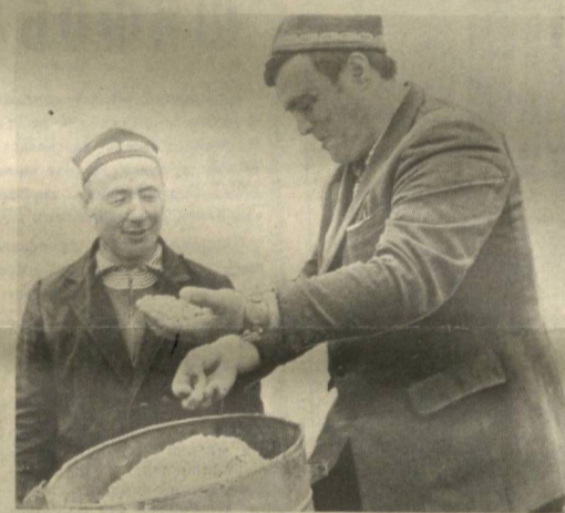
Ховос районидagi Мичурин номи совхозга қарашли «Богбоғ» ишлаб чиқариш кооперативи аъзолари жорий йилда боғ ва полиз маҳсулотлари етиштириш билан бир қаторда 60 гектар майдонга гўза ўстиришдади. Ҳозир бу ерда чигит экин жадвал бормоқда.