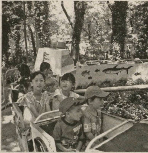
Жаннатмақон, хушманзара, сўлим ва файзли гўшаларимиз—маданият ва истироҳат боғлари айни кунда ҳамша- харларимиз билан гавжум.