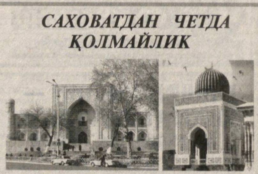
САҲОВАТДАН ЧЕТДА ҚОЛМАЙЛИК

Мамлакатимиз пойтахти—Тошкент шаҳрида жойлашган, халқимиз маънавий меросининг узвий бир қисми бўлган Ҳазрати Имом (Ҳастимом) маъморий мажмуасида қурилиш, таъмирлаш ва ободонлаштириш ишларини амалга ошириш мақсадида «Ҳазрати Имом (Ҳастимом) жамоатчилик жамғармасини қўллаб-қувватлаш тўғрисида» Президентимиз томонидан қабул қилинган Қарор бундан ҳамюртларимизнинг кўнгилларини хушнуд этди. Зеро, ушбу Қарор муқаддас ислом дини ва фалсафасини, унинг инсонпарварлик ғояларини кенг ёйишга хизмат қилиб келаётган илмий-маърифий марказнинг асл тарихий қиёфасини тиклаш, бу ерда кенг қўламли қурилиш-таъмирлаш ва ободонлаштириш ишларини амалга ошириш, мажмуаниннг инфратузилмасини ҳар томонлама ривожлантиришда муҳим ўрин тутаети.