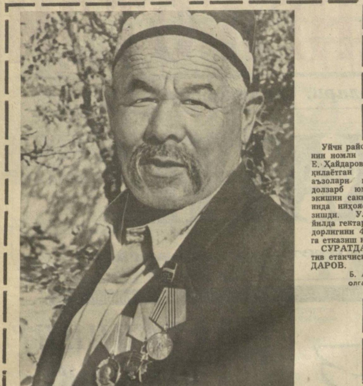
Ушч районидagi Ленин номи колхозининг бригадаси аъзолари йўқотган долзарб юмуши...