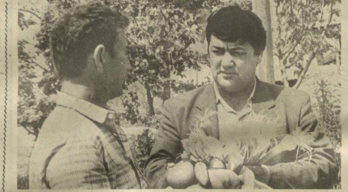
Қалинин районидagi «Қорасув» совхозида миришқор деҳқонлар кўп. Сабзавоткорлар ҳар қарчир ердан оқилорна фойдаланиб...