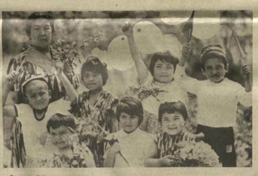
Дилларда байрам нашидаси.

ХАНДАЛАР Бернард Шоу бир янги пьесани томоша қилишга таклифнома олди. Томошадан сўнг режиссер ёзувчидан сўради. — Комедия, драма ва трагедия ўртасида қандай фарқ бор?