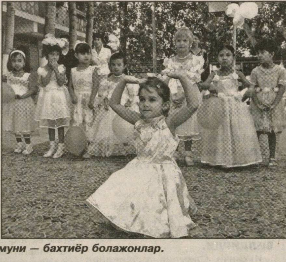
Келажак гулгунчаси, ҳаётимиз мазмуни — бахтиёр болажонлар.