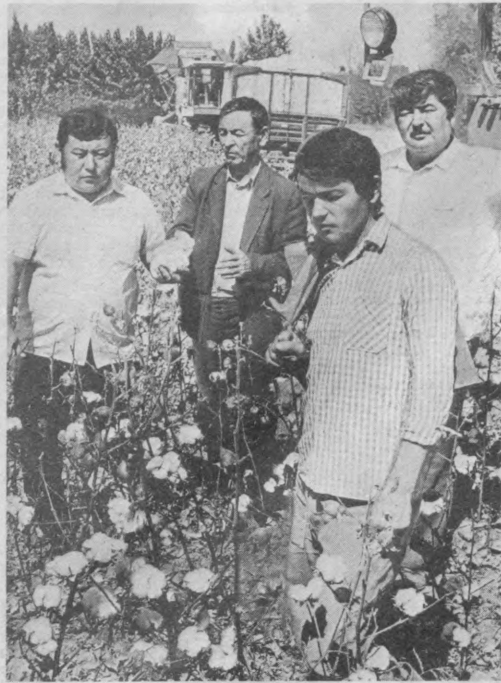
Пискент районидagi «Гулистон» жамоа хўжалиги пахтакорлари бу йил 1.150 гектар майдонда мўл ҳосил еттиштирдилар. Ватан хирмониغا 3.000 тонна юқори наъ хом ашё тортиқ қилинади. Ҳозир даладарда йиғим-терим жадал бормоқда. Бу юшубга 23 та зангори кема, 56 та тежежа сафарбар этилган.