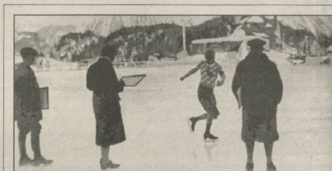
СУРАТДА: ўша вақтда Олимпиададаги фигурали учуш мусобақаларида ҳакамлар спортчилар томонидан машқар қандай баҳарлаётганлигини баҳолаш учун улар қиқшиларини бевосита яхмалакка қиқиб қузатиб турардилар.

қадар унинг номи спорт ихлосмандларига деярли маълум эмасди. Пиетри марафон югуришида даставвал пешқадамлар сафида эмасди. Масофанинг катта қисмига Жаңубий африкалик Чарльз Хофферсон рақибларидан анча илгариде борарди. Бироқ марафоннинг сўнгги босқичида Дорандо Пиетри бор кучини ишга солиб, стадионга биринчи бўлиб югуриб киради. Лекин унинг бутун ўй – хаёли муросасиз беллашувга берилганлиги сабабли югуриш йўлакчаси