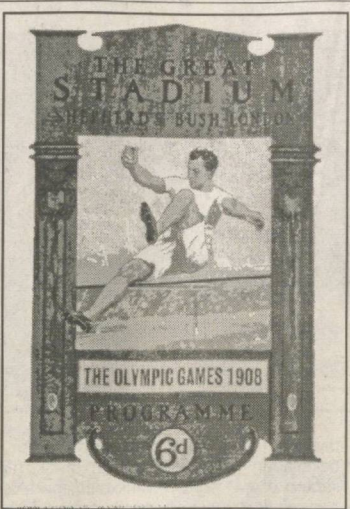
СУРАТДА: Лондонда катта муваффақият билан ўтган IV Олимпиада ўйинлари плакати.

Навбатдаги IV Олимпиада ўйинлари бошланишига бир йил қолганда улар ўтказилиши яна хавф остида қолди. Холбуки, Олимпиадага даставвал тўрт шаҳар – Берлин, Лондон, Рим ва Милан мезбонликка даъвогарлик қилган эди. Бироқ, Германия Миллий олимпия қўмитаси ўз ҳуқуқати томонидан қўллаб-қувватланмаганлиги сабабли Берлин шаҳри номзодини қайтариб олди. Халқаро Олимпия Қўмитаси қолган уч номзоддан Римни маъқул тоғди.