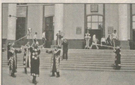
Олий ўқув юртларида