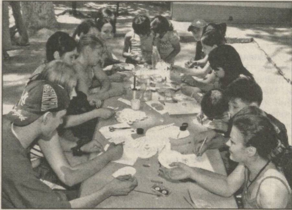
Юртбошимиз ташаббуси билан қабул қилинган кадрлар тайёрлаш миллий дастури, 2004-2009 йилларда Мақтаб таълимини ривожлантириш Давлат умуммиллий дастурида ёшларларнинг барча турдаги ёзги оромгоҳларини мавсумга ҳар томонлама тайёрлаш юзасидан зарур чора-тадбирлар қўрилиб, барча зарур технологик асбоб-ускуналар, алоқа воситалари

Анъанага кўра, бу йил ҳам болаларнинг ёзги соғломлаштириш ва дам олдириш мавсуми 1 июнь — Халқаро болаларни ҳимоялаш кўни бошланади. Ҳозир ушбу масала учун масъул барча ташкилотлар, ҳокимликлар, вазирлик ва идоралар мавсумга жиддий эътибор қаратмоқда. Бу йил юртимиздаги етти юздан зиёд болалар соғломлаштириш оромгоҳларида икки юз ўттиз минг нафардан ортиқ ўғил-қиз дам олади. Бу эзгу мақсадлар учун қасаба уюшмалари, ҳокимликлар, Республика "Маҳалла" хайрия жамғармаси, ҳимий ташкилотлар маблағларини йўналтирган ҳолда ўн икки миллиард сўмга яқин маблағ сарфланиши кўзда тутилган. Дам олиш масканларида Меҳрибонлик уйлари, ҳокимликлар, Республика "Маҳалла" хайрия жамғармаси, ҳимий ташкилотлар маблағларининг икки минг нафар тарбияланувчиси бепул ҳордиқ чиқаради. Қорақалпоғистон Республикаси ҳамда Хоразм вилоятидан уч минг нафар бола Тошкент шаҳри ва Тошкент вилояти қорхоналарига қарашли сўлим оромгоҳларда бепул дам олади.